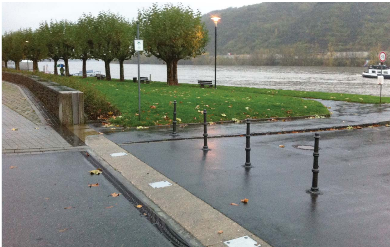
Espace public ouvert sur le Rhin

En octobre 2004 ont commencé les travaux pour les ouvrages de protection, pris en charge à 90 % par le Land de Rhénanie-Palatinat, le restant étant à la charge de la commune.