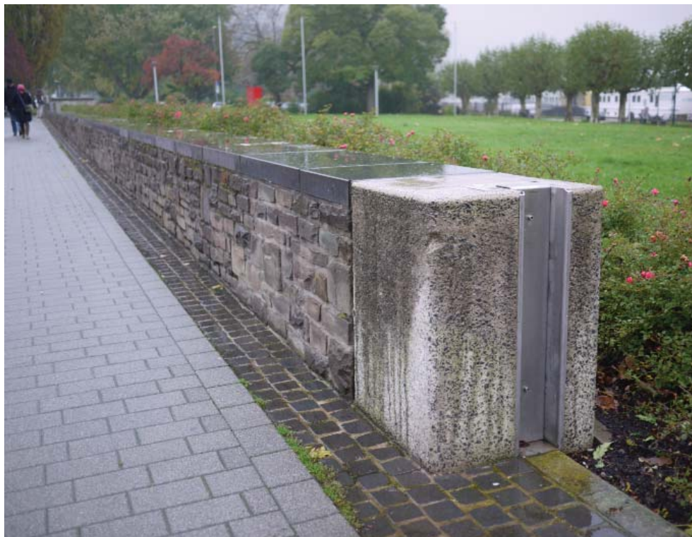
Système de panneaux amovibles à installer sur le mur en cas de forte inondation