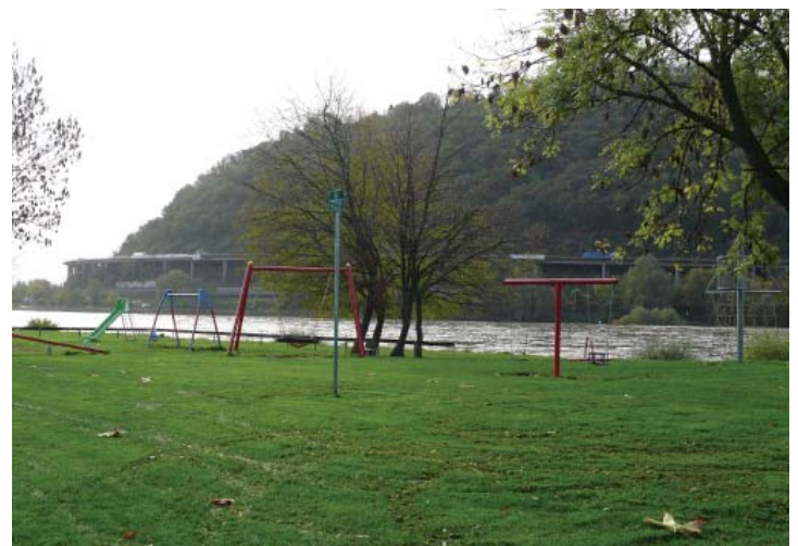
... de jeux

Textes : Andrea Spöcker, 2013 © Tous droits réservés