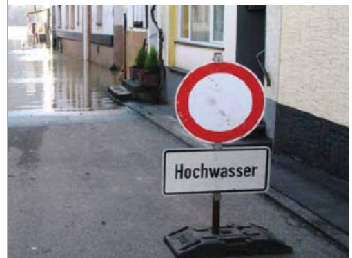
Extrait de : Le rôle de la prévention en matière de construction en vue d'une résilience efficace contre les inondations

Pour aller plus loin : www.leutesdorf.com/