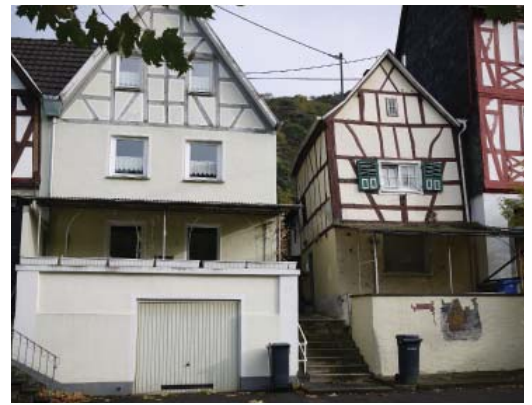
Surélévation des habitations