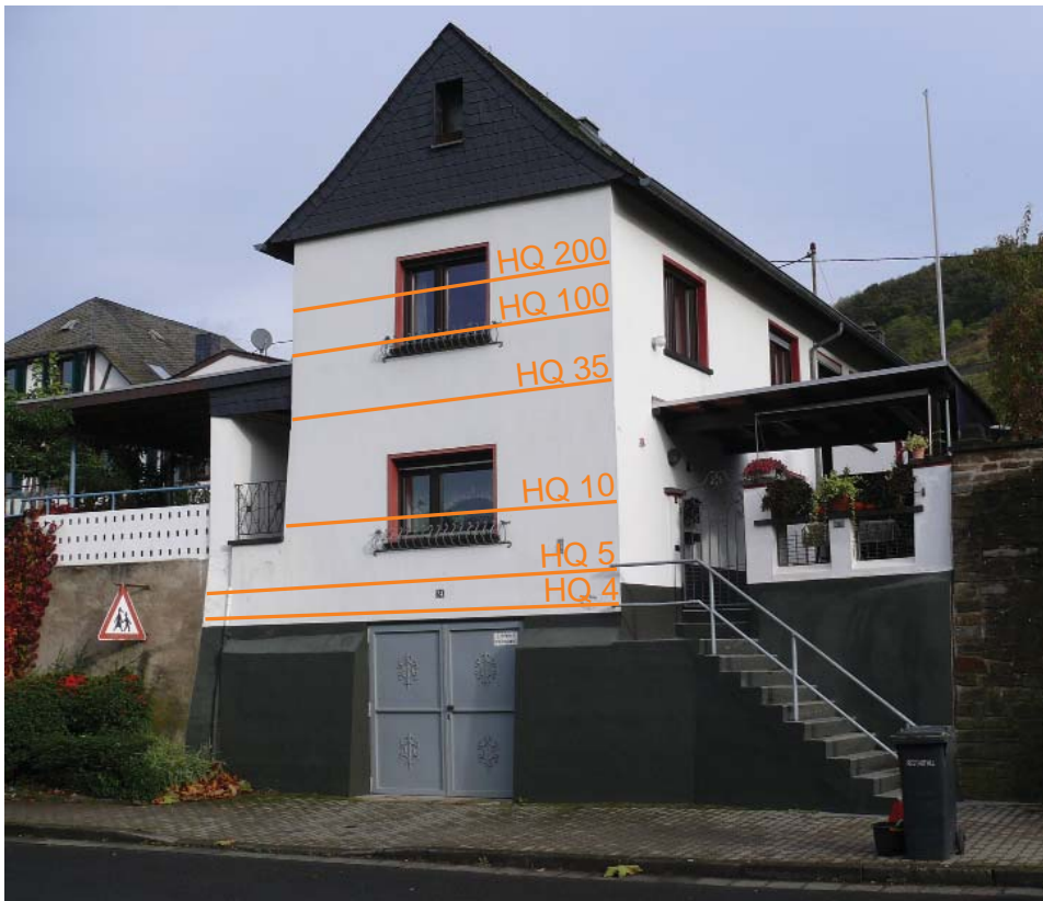
Hauteurs de crue sur une habitation