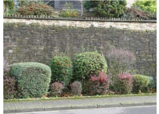
Mur de protection végétalisé des maisons