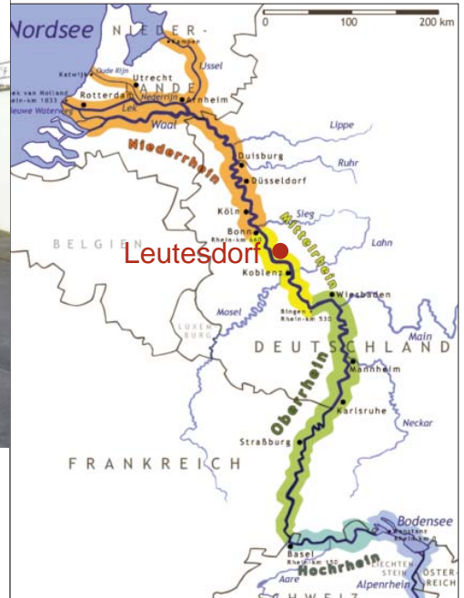
Extrait de : Programme local de protection contre les inondations avec participation de la population

Land : Rhénanie-Palatinat Altitude : 75 - 373 m Nombre d'habitants : 1 788 (2009) Densité : 166 hab/km 2