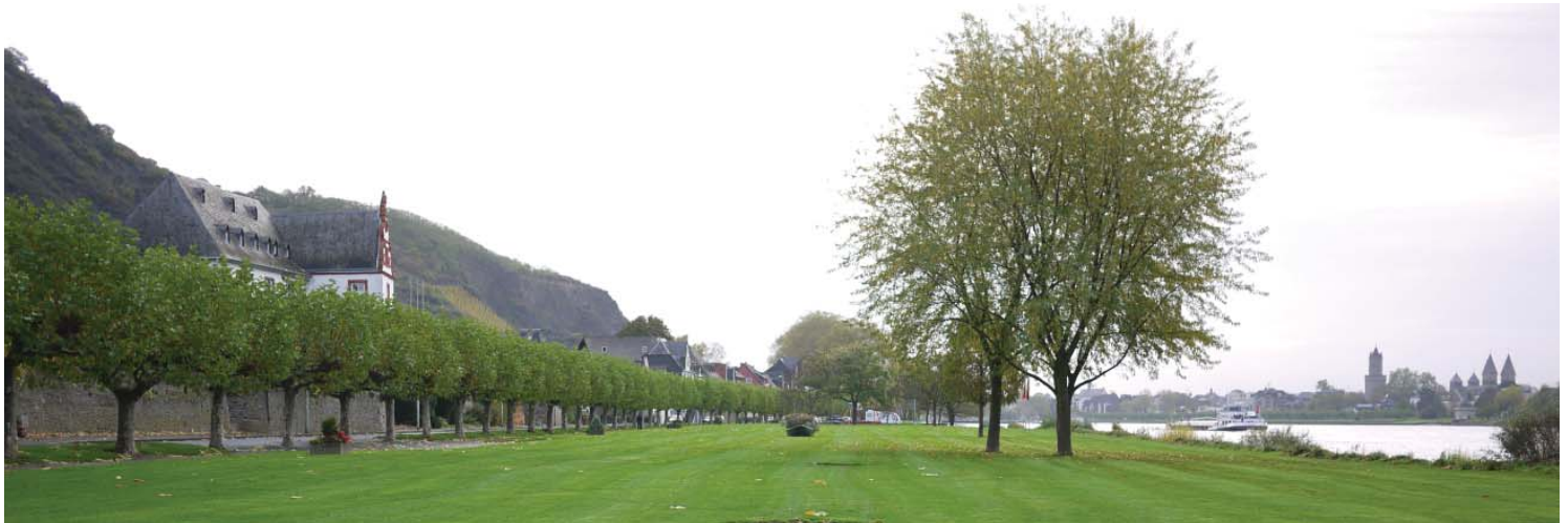
... de détente