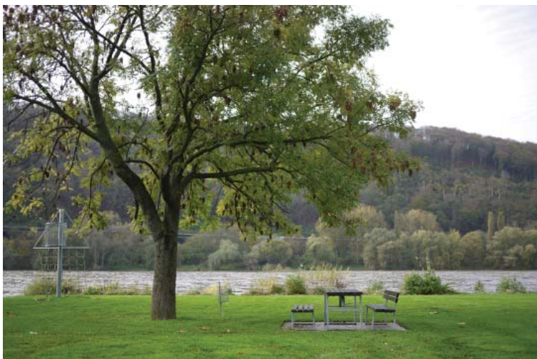
... de pique-nique