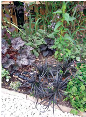
Ophiopogon , Vinca minor (pervenche), Heuchera (heuchère)...