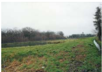
Station par lagunage de Jouy-le-Potier

Le dos de la station d'épuration par lagunage de Jouy-Le-Potier s'intègre parfaitement dans un paysage de Sologne, avec sa forêt et ses étangs. Mais son entrée présente au public un vaste espace résiduel, un grillage tenu par des poteaux en ciment, un portail rouillé... Cette entrée gâche les atouts d'intégration des bassins de lagunage dans ce paysage.