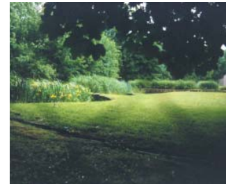
Station de Saint-Bohaire, Loiret-et-Cher

Textes, croquis, photos : Élise Boissay, paysagiste DPLG.