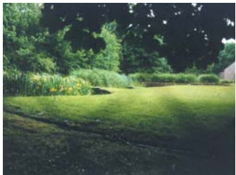
Station de St-Bohaire, Loir-et-Cher