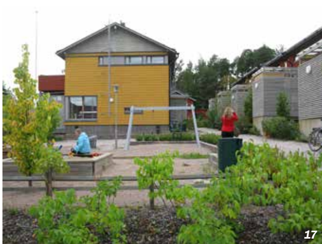
Porvoo - Finlande

La gestion globale des eaux pluviales des Eparviers (23 lgts/ha) oblige à la création d'un vaste espace de rétention. Placé au cœur du quartier entre deux bandes de maisons groupées, il devient par temps sec un formidable terrain de jeux pour les enfants.