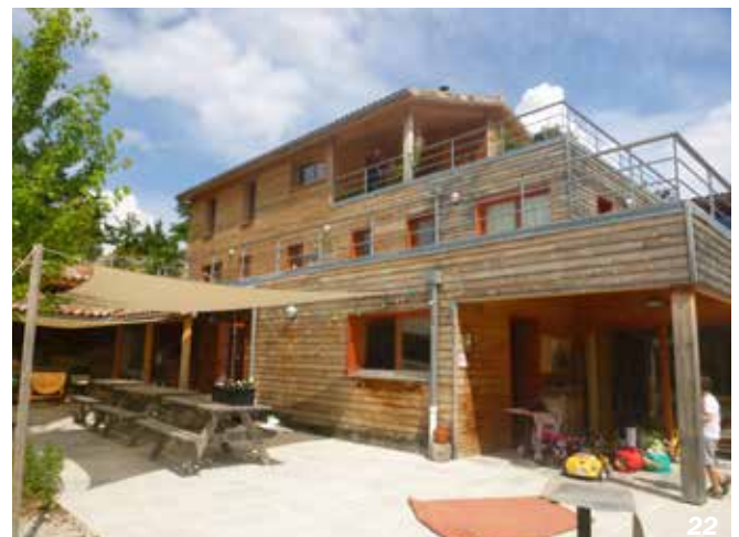
Die - 26

Dans l'immeuble K'HUTTE (185 lgts/ha), les 23 logements et locaux professionnels sont desservis par de profondes coursives munies de boîtes individuelles de rangements. Mais aussi d'une terrasse partagée avec préau et buanderie au dernier étage et d'un atelier de bricolage au RDC.