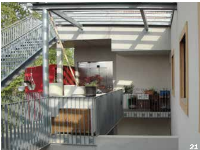
Strasbourg - 67

Dans un objectif d'économie de surfaces et de maîtrise des coûts, des espaces gagnent à être mis en commun par les habitants : local vélos, buanderie collective, salle commune avec cuisine dédiée, studio pour les invités temporaires, jardins potagers, cabane à outils... Les idées de locaux et d'espaces à partager ne manquent pas et permettent d'offrir des services à moindre coût. Cette démarche de mutualisation n'empêche pas la conception d'espaces de rangements intérieurs et extérieurs individualisés.