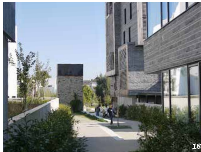
Nantes - 44

Structuré par des espaces de jeux collectifs et des circulations douces, le cœur de cet îlot dense (33 lgts/ha) regroupe plusieurs logements dans des maisonnettes ouvrant sur des espaces communs.