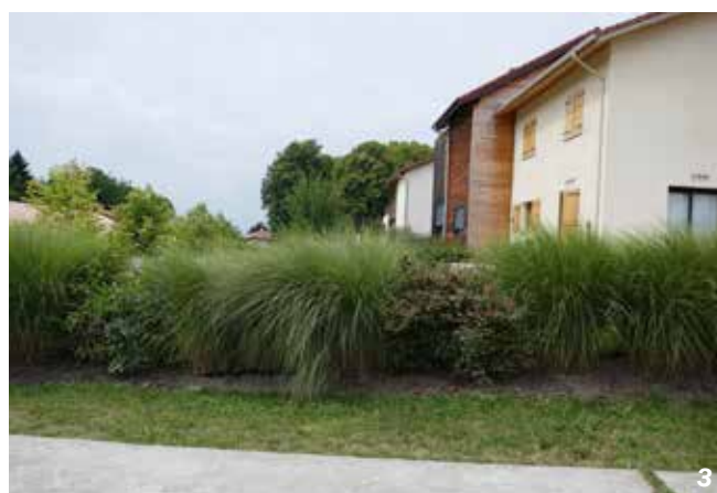
Notre-Dame-de-l'Osier - 38

L'échelonnement dans la pente de la vingtaine de maisons de cette opération de logements sociaux (23 lgts/ha) garantit l'ensoleillement plein sud des jardins et des terrasses et le panorama sur les montagnes alentours.