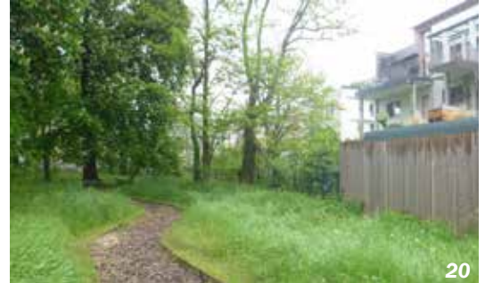
Strasbourg - 67 - quartier Neudorf