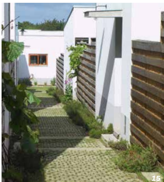
Saint-Jacques-de-la-Lande - 35

résidents. Lorsque les automobiles y sont correctement gérées, les voies de desserte permettent aussi le développement d'activités personnelles et partagées, facteurs de bien-être, telles que les jeux d'enfants, les rencontres entre voisins... La traque des délaissés fonciers et l'efficacité des répartitions entre bâti et espaces verts rendent possible la création de ces lieux en complément des aménagements privés.