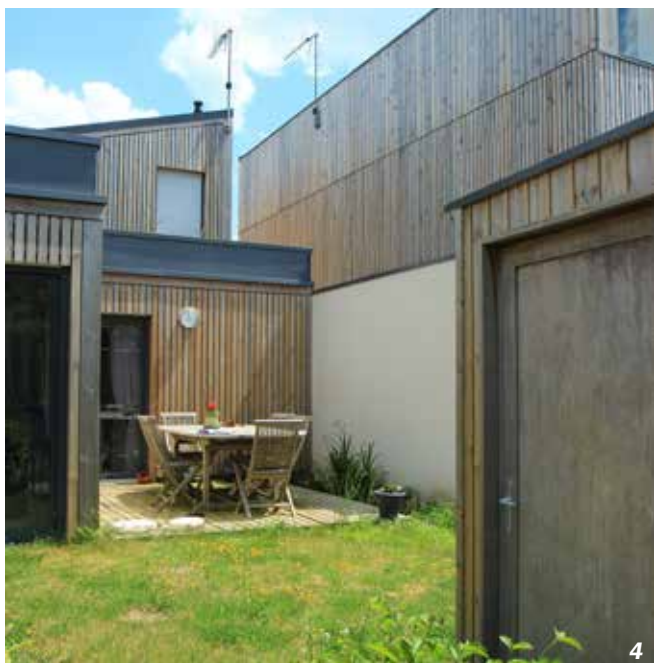
La-Chapelle-des-Marais - 44

Ce petit lotissement communal d'une dizaine de lots libres (25 lgts/ha) a été prévégétalisé pour garantir la qualité des espaces de transition entre espace public et jardins privés.