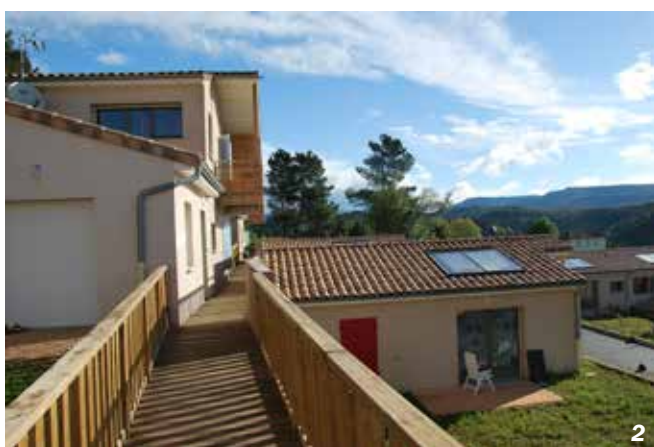
Saint Julien-du-Serre - 07

confort climatique d'un habitat dense : îlots de fraîcheur l'été par la maîtrise des ombrages et une aération naturelle, ensoleillement des façades et compacité des espaces l'hiver. La gestion des vis-à-vis cherche à limiter les vues directes, frontales ou plongeantes entre les logements et les espaces extérieurs, et à réguler les échanges en proposant une transition en mitoyenneté, pour minimiser le sentiment de proximité. Cela passe par des décrochements en façades, des niveaux de sol de hauteur variée, la disposition des garages, l'articulation des îlots d'habitation... Cette conception globale doit enfin tenir compte des nuisances occasionnées par le bruit (usages de l'espace public et de la voirie) et la pollution de l'air pour offrir un cadre de vie sain et confortable.