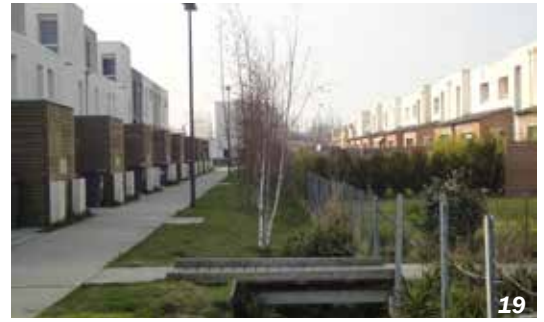
Villeneuve-d'Asc - 59 - La Haute Borne

La récente prise en considération des continuités écologiques dans l'aménagement des territoires à travers la trame verte et bleue, va dans ce sens. Composée des espaces naturels terrestres et aquatiques, elle constitue un véritable atout pour l'aménagement des espaces urbanisés et leur densification. Renouant avec la nature en ville, la prise en compte de la trame verte et bleue dans l'aménagement ancre la densification des villes et des villages dans le socle géographique et historique des territoires en préservant la biodiversité.