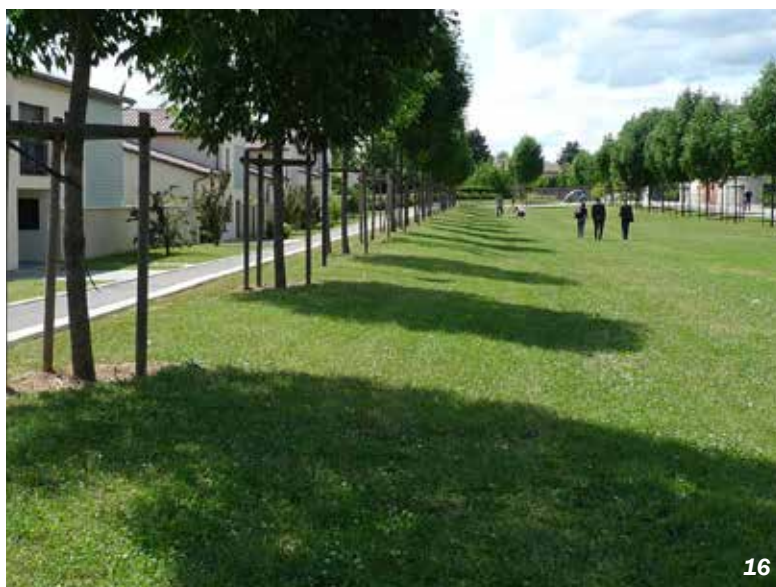
Solaize - 69

Le Village du Haut-Bois (117 lgts/ha) est un îlot traversé d'un dédale de venelles piétonnes et de placettes-jardins. La mixité des formes d'habitat a permis la création de stationnement enterré sous les immeubles, libérant totalement l'îlot de la voiture.