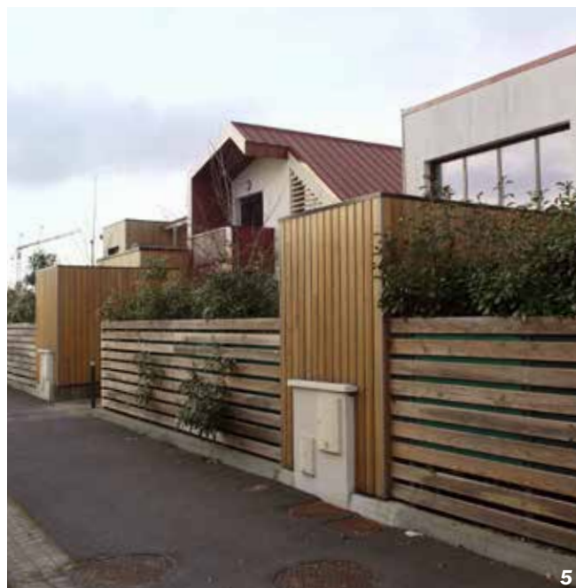
Ingré - 45

Dans le groupement de maisons mitoyennes et petit collectif d'Arbora (38 lgts/ha), les espaces extérieurs privatifs sont protégés des vues par l'imbrication des volumes et la disposition des ouvertures.